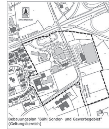
Bebauungsplan "Bühl Sonder- und Gewerbegebiet" (Geltungsbereich)

Während der frühzeitigen Öffentlichkeitsbeteiligung können Stellungnahmen bei der vorgenannten Stelle abgegeben werden.