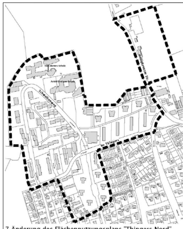
7. Änderung des Flächennutzungsplans "Thingers-Nord" (Geltungsbereich)

Während der frühzeitigen Öffentlichkeitsbeteiligung können Stellungnahmen schriftlich oder mündlich zur Niederschrift abgegeben werden.