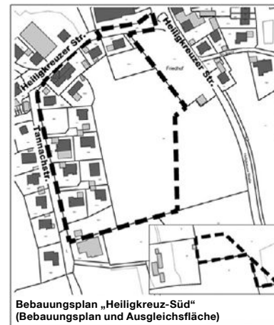
Bebauungsplan „Heiligkreuz-Süd“ (Bebauungsplan und Ausgleichsfläche)

Während der frühzeitigen Öffentlichkeitsbeteiligung können Stellungnahmen beim Stadtplanungsamt abgegeben werden.