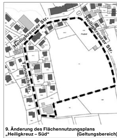
9. Änderung des Flächennutzungsplans „Heiligkreuz - Süd“ (Geltungsbereich)

Darüber hinaus ist der Vorentwurf in diesem Zeitraum auch auf der Internetseite des Stadtplanungsamtes der Stadt Kempten (Allgäu) unter der Adresse: www.kempten.de abrufbar. Während der frühzeitigen Öffentlichkeitsbeteiligung können Stellungnahmen beim Stadtplanungsamt abgegeben werden.