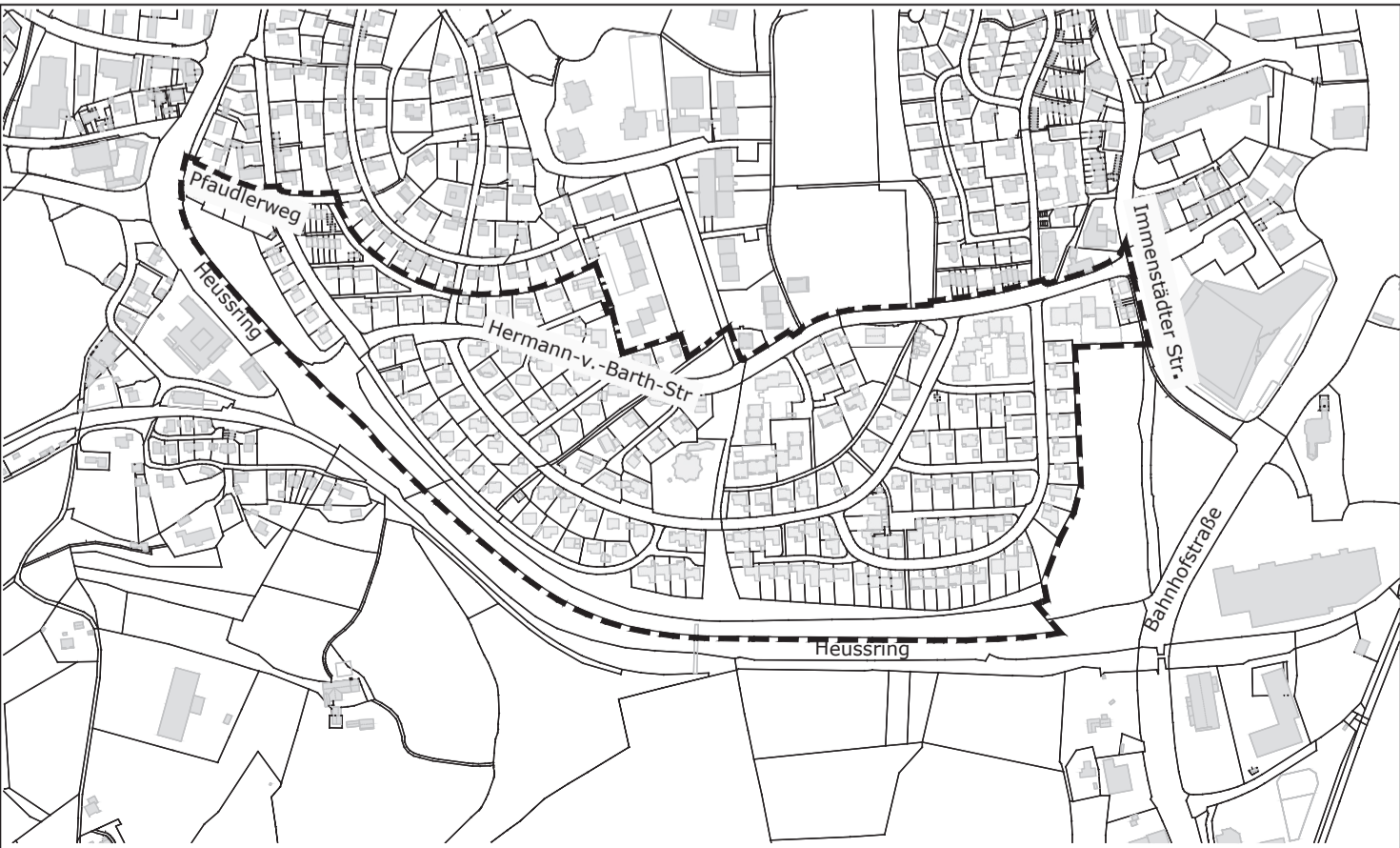
Bebauungsplan "Hermann-v.-Barth-Straße" (Geltungsbereich)

Die Stadt Kempten (Allgäu) hat mit Beschluss vom 22.12.2022 die Aufhebung des Bebauungsplans „Serrostraße“, einschließlich seiner drei Änderungen, als Satzung beschlossen. Dieser Beschluss wird hiermit gemäß § 10 Abs. 3 des Baugesetzbuchs (BauGB) ortsüblich bekannt gemacht. Mit dieser Bekanntmachung tritt der Bebauungsplan, einschließlich seiner drei Änderungen außer Kraft. Jedermann kann die Aufhebungssatzung mit der Begründung sowie die zusammenfassende Erklärung über die Art und Weise, wie die Umweltbelange und die Ergebnisse der Öffentlichkeits- und Behördenbeteiligung in der Aufhebungssatzung berücksichtigt wurden, und aus welchen Gründen der Plan nach Abwägung mit den geprüften, in Betracht kommenden anderweitigen Planungsmöglichkeiten gewählt wurde, im Stadtplanungsamt im städtischen Verwaltungsgebäude Kronenstraße 8, 3. OG, Zimmer 305, während der Dienststunden einsehen und über deren Inhalt Auskunft verlangen. Auf die Voraussetzungen für die Geltendmachung der Verletzung von Verfahrens- und Formvorschriften und von Mängeln der Abwägung sowie die Rechtsfolgen des § 215 Abs. 1 BauGB wird hingewiesen. Unbeachtlich werden demnach