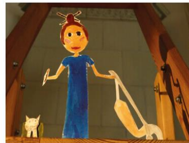
Ottilie, die Staubsauger-Malerin