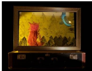
Der flammende Fuchs