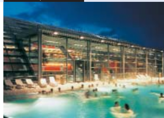
Parco acquatico CamboMare

Rilassarsi con l'idromassaggio. Nel parco acquatico CamboMare il divertimento e il relax sono assicurati. La zona dedicata ai bagni a vapore offre dieci tipi di sauna e un'area esterna attrezzata e allestita con cura.