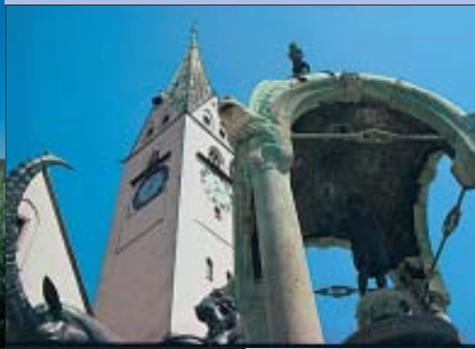
Chiesa di San Magno