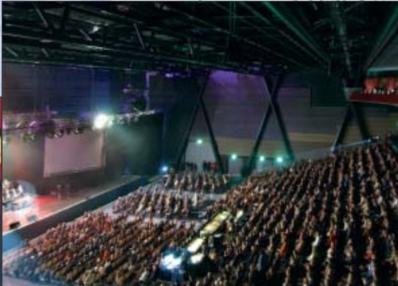
Manifestazione nella bigBOX Allgäu

Tra le manifestazioni di rilievo va segnalata la "Allgäuer Festwoche". Quella che letteralmente viene chiamata "settimana di festa dell'Algovia" è in realtà un importante evento economico per tutta la regione che si tiene ogni anno ad agosto. Accanto all'esposizione fieristica che accoglie più di 400 espositori, Kempten propone un ricco programma di eventi culturali e sportivi.