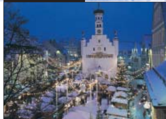
Il mercatino di Natale

Il mercatino di Natale di Kempten è il più grande dell'Algovia e uno tra i più belli di tutta la Baviera; la sua magica e suggestiva atmosfera incanta giovani e meno giovani.