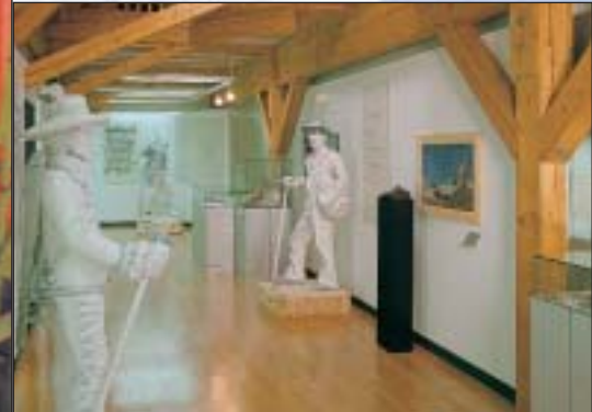
Museo Alpino nel Marstall

Il Museo dell'Algovia presenta su un'area espositiva di sei piani: l'arte, la cultura, la storia di Kempten e della sua regione. L'esposizione conta pezzi rari e pezzi unici che delineano un percorso attraverso i secoli. Materiale audiovisivo e postazioni interattive fanno in modo che i visitatori non si limitino a osservare ma siano coinvolti attivamente.