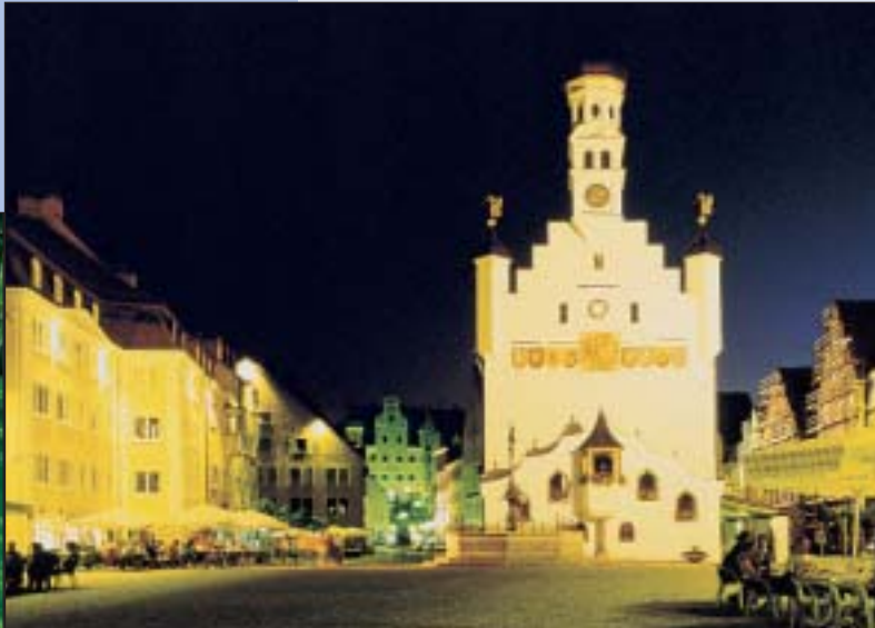
Piazza del municipio

Kempton è il centro nevralgico dell'Algovia , con i suoi 68 000 abitanti e i 500 000 abitanti delle aree limitrofe, è un importante luogo d'incontro.