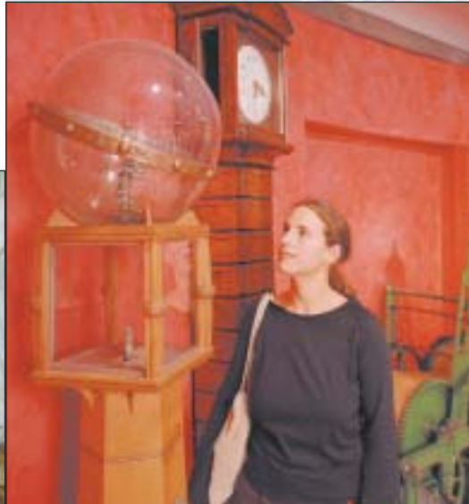
Museo dell'Algovia nel Kornhaus

Una visita al parco archeologico Cambodunum - APC , riesce a portare in vita un tempo ormai lontano, il tempo dell'antica città romana di Cambodunum e degli dei allora venerati. Grazie a numerosi scavi, le costruzioni in pietra di Cambodunum sono state via via portate alla luce e offrono uno sguardo sulla vita cittadina di allora; il parco è diviso in tre sezioni: l'area del tempio galloromano , con diversi templi e altari, le "piccole terme" coperte da una struttura di protezione, e la pianta del foro . La piazza centrale era al contempo adibita a funzioni civiche, religiose e commerciali ed era circondata da edifici pubblici, il più imponente era la basilica, grande quanto l'attuale basilica di San Lorenzo. Oltre alle "piccole terme" ad uso esclusivo del governatore romano, esisteva un bagno pubblico molto più grande, le "grandi terme" con piscina, caldarium e campo sportivo.