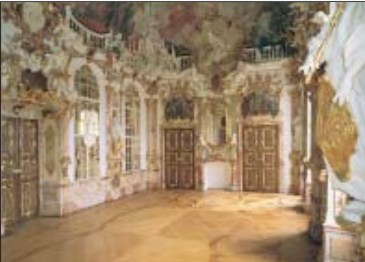
Residenza, la sala del trono

Le fastose sale della Residenza erano gli ambienti di rappresentanza del principe abate. L'anticamera, la sala delle udienze, il soggiorno e la camera da letto in stile Regency, la sala del trono in uno straordinario rococò.