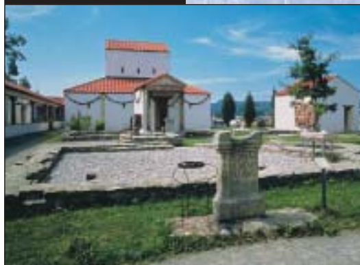
L'area dei templi galloromani nel APC

Un diverso modo di esplorare la montagna è ciò che propone il Museo Alpino di Kempten, il più grande museo di storia alpina in Europa. L'esposizione mostra l'evoluzione geologica delle Alpi e il faticoso processo di colonizzazione dell'area alpina da parte dell'uomo. Oltre alle sezioni dedicate alla flora e alla fauna, c'è una parte del museo che racconta la storia dell'alpinismo da Edward Whymper a Reinhold Messner. Sci, scarponi da neve e slitte illustrano la storia degli sport invernali.