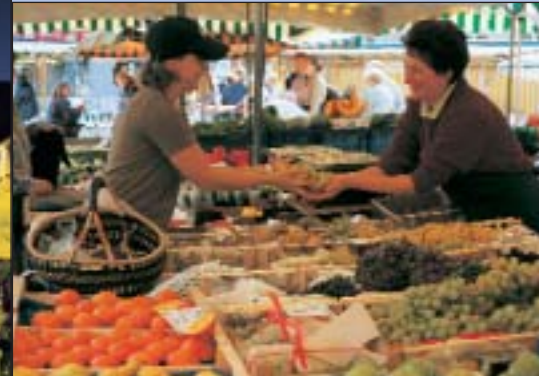
Mercato settimanale in Hildegardplatz

I bavaresi d'Algovia hanno un simpatico modo di conciliare la laboriosità cittadina e lo stile di vita tranquillo ed è proprio questa particolare caratteristica che rende così piacevole un soggiorno a Kempton: una vecchia città dallo spirito giovane e dall'atmosfera allegra.