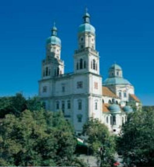
Basilica di San Lorenzo

Con la citazione del geografo greco Strabone Kempten si aggiudica la più antica testimonianza scritta tra le città tedesche. Per 600 anni la città rimane divisa. Le ostilità tra la libera città imperiale e la città monastica governata dal principe abate hanno termine nel 1818 su ordinanza del re di Baviera.