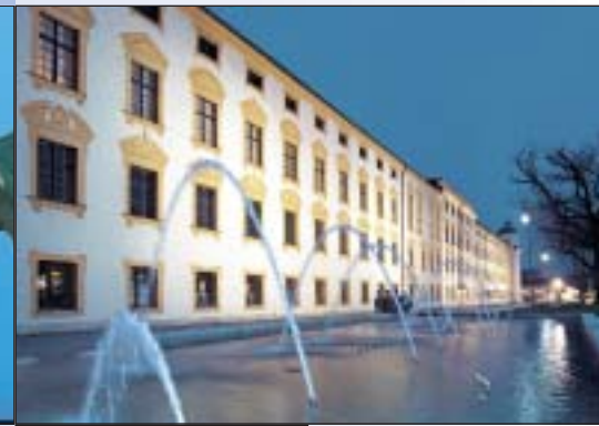
Residenza dei principi abati

18/23 d.C. Menzionata per la prima volta dal geografo greco Strabone, Cambodunum è in quest'epoca la città più importante della provincia romana di Rezia e periodicamente ne è il capoluogo.